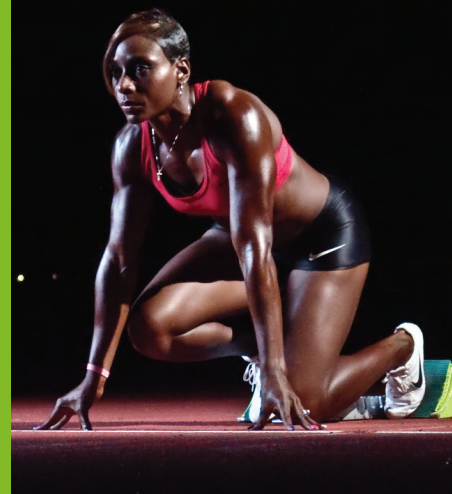
DAMU CHERRY US-olympischer Hürdenläufer

„Matcha ist super, denn es gibt mir vor einem anstrengenden Tag einen Energiekick und hilft mir, mich bei langen Workouts zu konzentrieren. Auch bevor ich in den Krafraum gehe, nehme ich jeweils ein Sachet für zusätzliche Energie.“